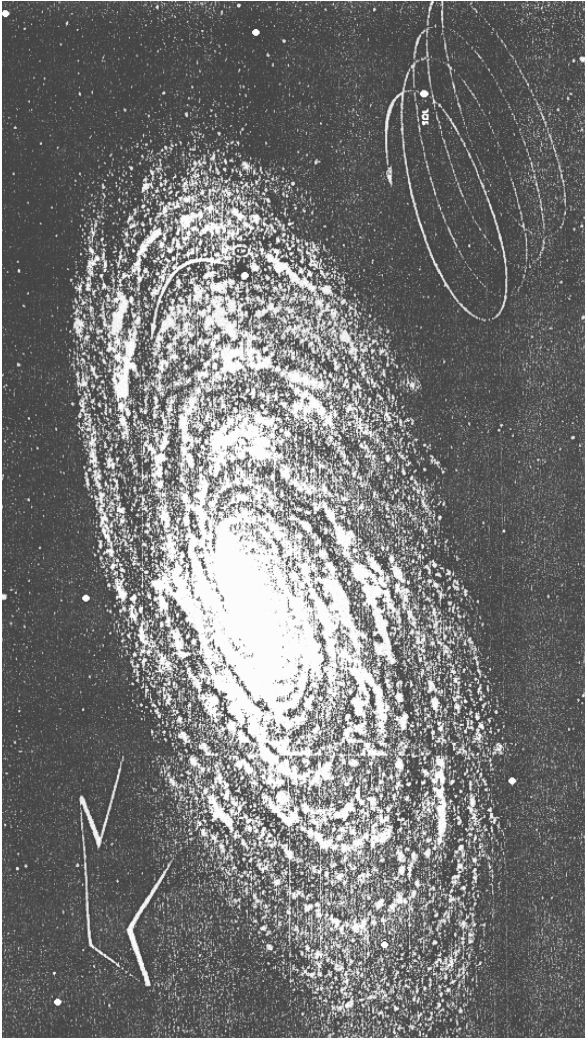
Ilustração n 2 - Esta fotografia tirada por astrônomos, mostra-nos a nossa Galáxia, chamada VIA- LÁCTEA. Nela se encontram o nosso sol e milhões de outros sóis. Sim, são milhões de outros sóis.

O Nosso Sol está assinalado à direita e em baixo da foto.