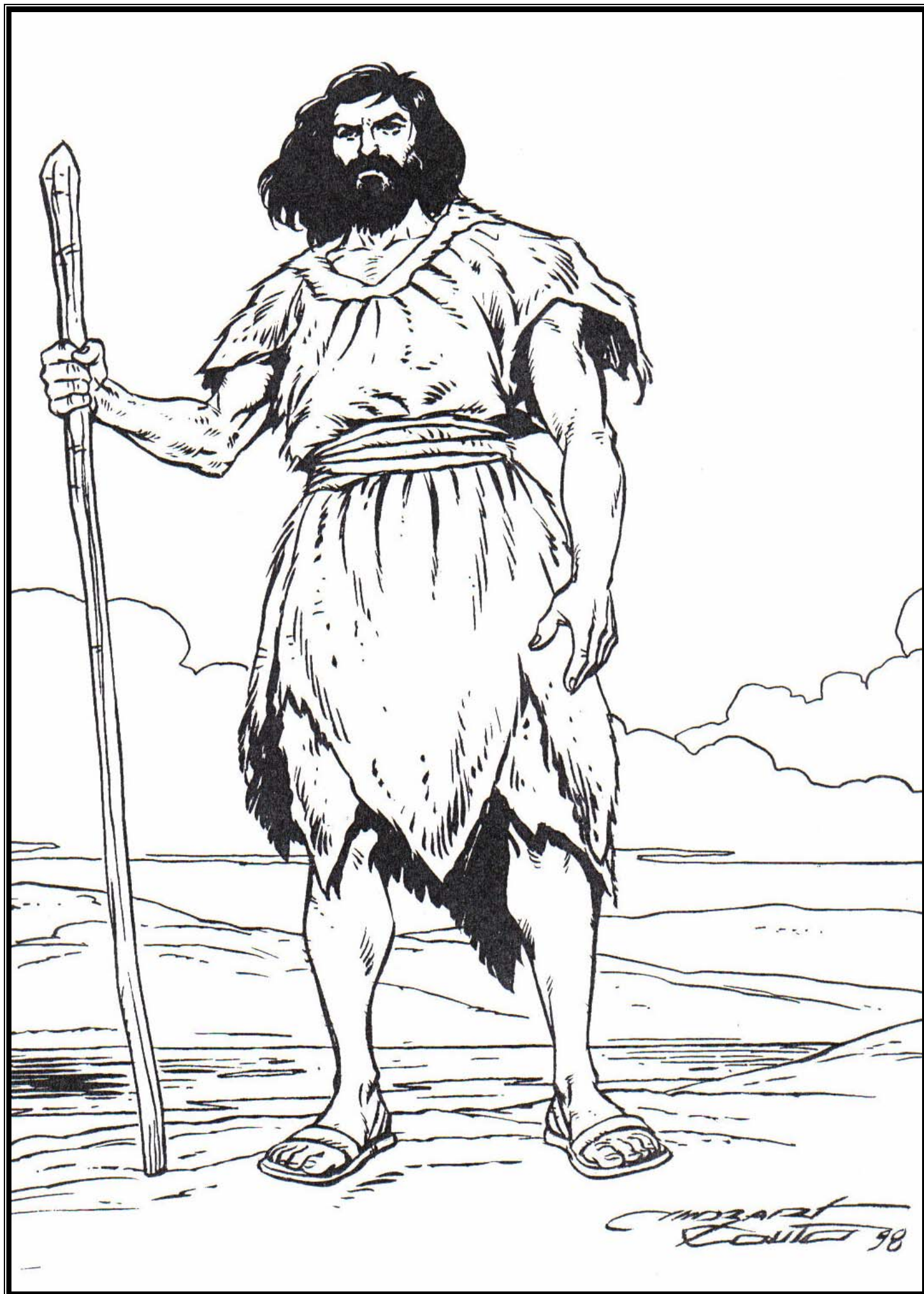
ILUSTRAÇÃO Nº 01